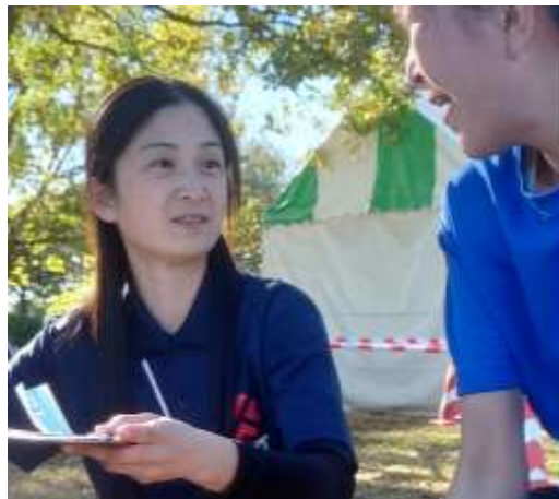
アスリートのメンタルケアと カウンセリングスキル