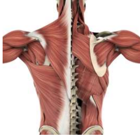
筋肉、体の構造の実践的な知識