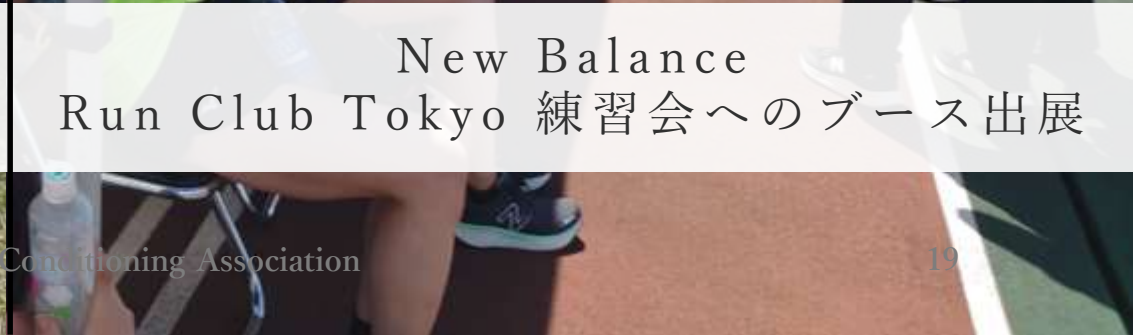
New Balance Run Club Tokyo 練習会へのブース出展