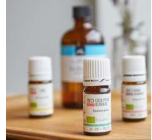
スポーツに効果的なアロマ精油の活用