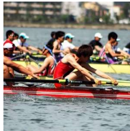
大阪公立大学 漕艇部